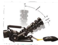
Angle minimal de 10°