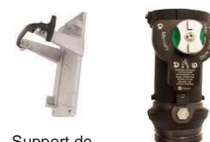
Support de Rangement Style 3448 FlowGuard