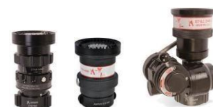
Tête Style 4446 Tête Style 4445 Tête Oscillante Style 5148