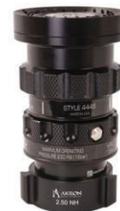
Tête Style 4446