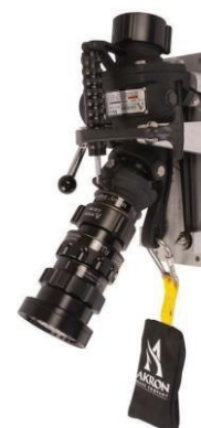
Exemple : support de rangement avec 3444 Quick Attack LE et tête 4446