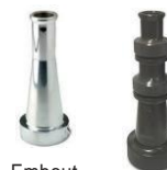
Embout Style 0489 Style 2420